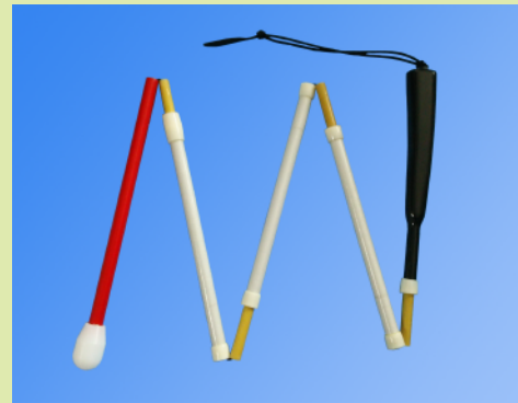
カーボングリップ ¥9,500