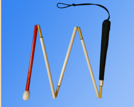
フィットグリップストレート ¥6,200 (ゴム)